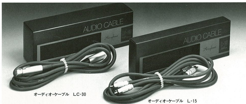
オーディオ・ケーブル LC-30

中心導体部は純度の高い無酸素銅を採用しています。構成は0.08mmφの単線をそれぞれポリウレタンで絶縁したリッツ線構造にしています。リッツ線は表皮効果が影響してくる高域の損失が少なく、特に導体が長くなるほどリッツ線の良さが発揮されます。アキュフェーズ・オーディオ・ケーブルは芯線にこの絶縁された0.08mmφの線を168本束ねて使用し、リッツ線の効果をより大きくすると共に直流抵抗も0.025Ω/mという極めて損失の少ないものになっています。0.08mmφ×168本の表面積は直径13.4mmの