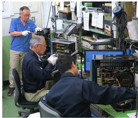
6人の熟練技術者が年間およそ2,000台の修理を行う